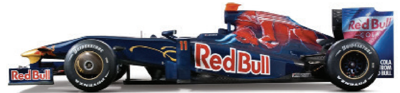
F1 TORO ROSSO